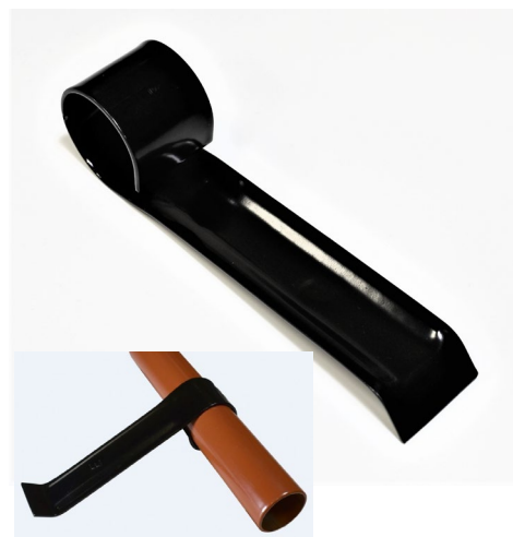
Rozražeč ledu na trubkový zachycovač

Rozražeč ledu na trubkový zachycovač pro trubku 32 mm se nasazuje na spodní trubku proti sklonu střechy a slouží pro zadržení zledovatělého sněhu. Používá se především pro falcovanou krytinu a krytinu se systémem CLICK. Rozražeč ledu je doplněk k trubkovému zachycovači sněhu.