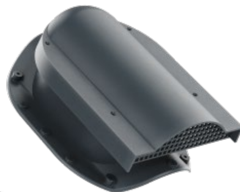
Větrací taška - VTXP

Větrací taška pro plechové krytiny je určena pro profilované plechové krytiny s výškou vlny 48 mm . Je vyrobena z kvalitního UV stabilního probarveného polypropylenu. Umožňuje odvětrání podstřešní mezery plechových krytin. Větrací taška je opatřena ochrannou mřížkou, která zabraňuje pronikání listů, ptáků a hlodavců do střešního pláště. Integrované butylové těsnění zajistí vodotěsnost mezi krytinou a větrací taškou. Určeno pro šikmé střechy se sklonem nad 15°.