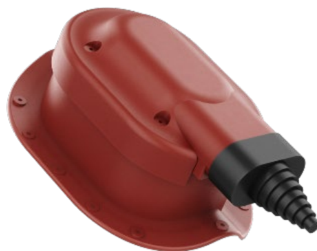
Solární prostup SET - SPVP