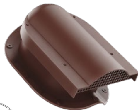
Větrací taška - VTNP

Větrací taška pro plechové krytiny je určena pro profilované plechové krytiny s výškou vlny 25 mm . Je vyrobena z kvalitního UV stabilního probarveného polypropylenu. Umožňuje odvětrání podstřešní mezery plechových krytin. Větrací taška je opatřena ochrannou mřížkou, která zabraňuje pronikání listů, ptáků a hlodavců do střešního pláště. Integrované butylové těsnění zajistí vodotěsnost mezi krytinou a větrací taškou. Určeno pro šikmé střechy se sklonem nad 15°.